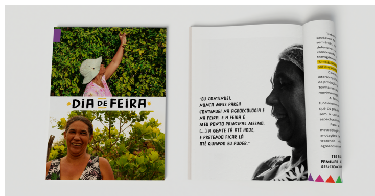
Diagramação da revista Dia de Feira (2021)