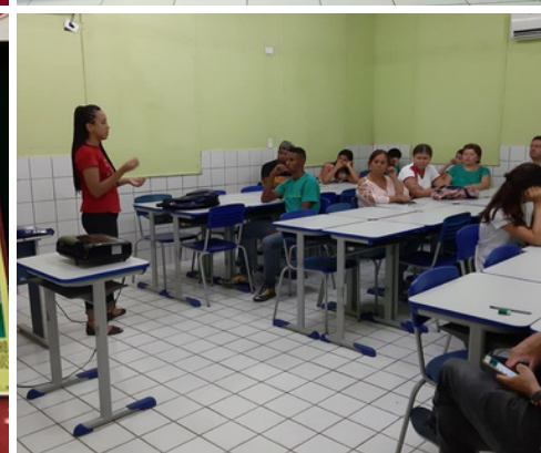
Oficina sobre escrita afrofuturista e sertãopunk - Instituto Trilhas Senador Pompeu (2019)