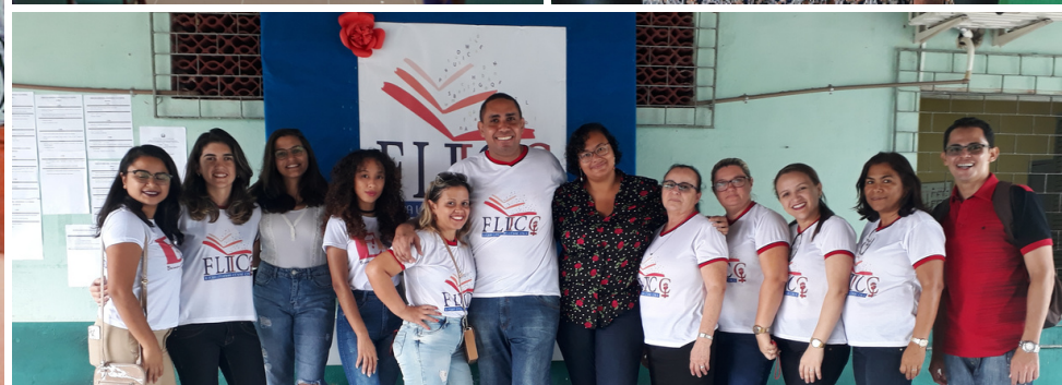
Palestra sobre formação do leitor - FLICC (2018)