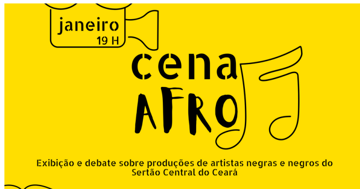
Peças para redes sociais do projeto Cena Afro(2021) Projeto contemplado pela Lei Aldir Blanc - Secretaria de Cultura do Estado do Ceará.