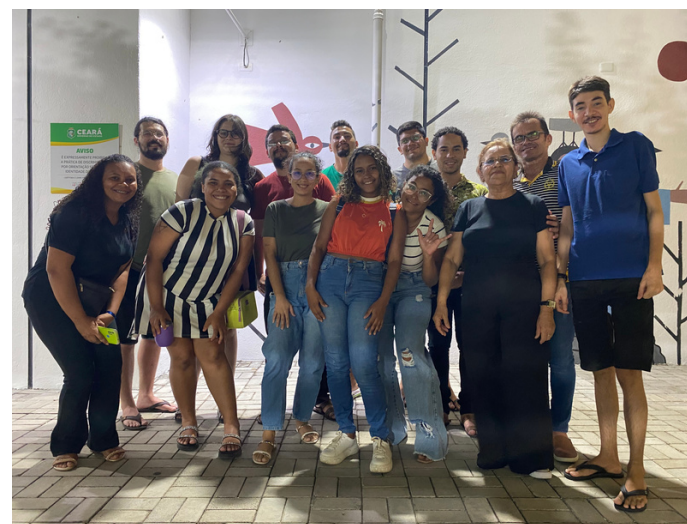
Ministrante da Formação em Acessibilidade Audiovisual, contemplando três módulos: Audiodescrição, LSE e projetos culturais. - Casa de Antônio Conselheiro (2024)