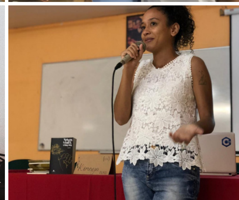
Palestra sobre mulheres negras na ficção científica e afrofuturismo - FECLESC/UECE(2019)