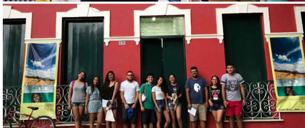
Criação do Clube de leitura de Quixadá (2018)