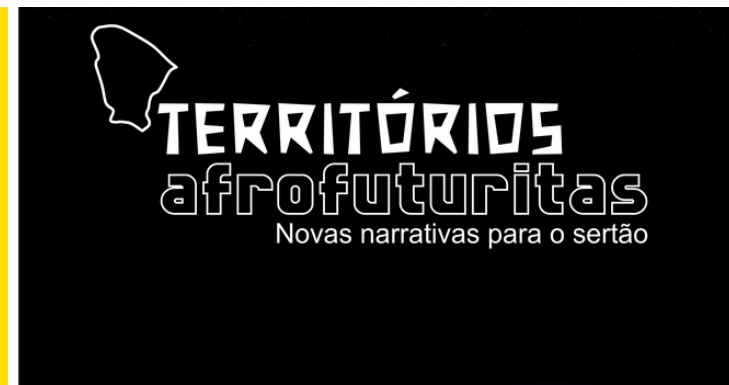
Identidade Visual e comunicação do projeto Territórios Afrofuturistas