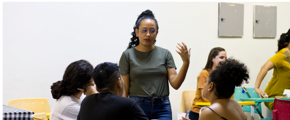
Artista-professora no Projeto Trans.Implic.Ações do Instituto Mirante. (2022)