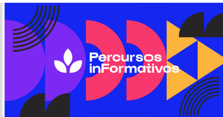
Comunicação e peças das redes sociais do Percursos Informativos Secult-Ceará (2022)