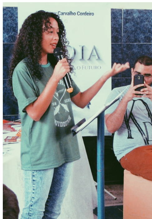
Palestra sobre processos de escrita - IV Diálogos Literários do CACD (2018)

Palestra sobre literatura e ativismo negro no Sertão Central - Bienal Internacional do Livro do Ceará (2019)