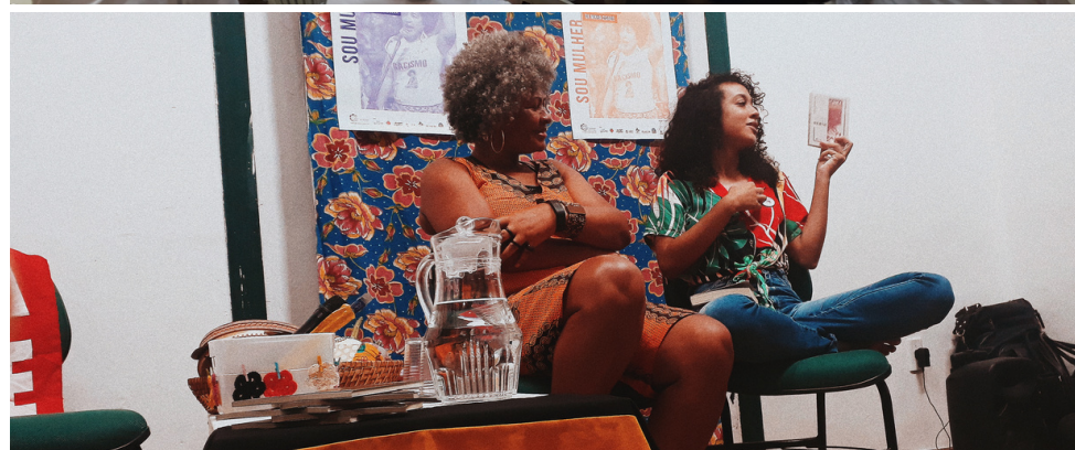
Mesa sobre literatura negra feminina - Jornada de Gênero do Sertão Central (2019)